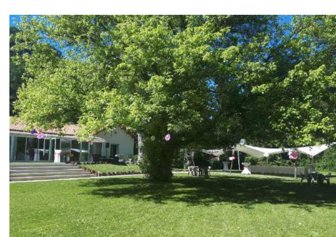
Le Domaine de la Palle à Pontgibaud (63) à proximité des Golfs : 1,2,3,4,5,6 Soirée étape à partir de 65€/p en chambre double