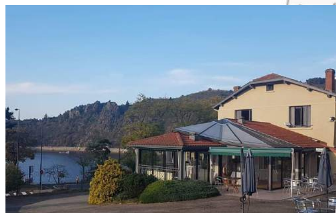
Pavillon du Lac à Saint-Etienne (42) à proximité des Golfs : 14,15,16,17,18 Soirée Etape à partir de 65€/p en chambre double