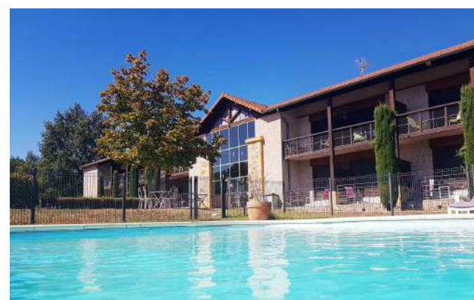
Hotel du Golf à Villerest (42) à proximité du Golf 20 Soirée Etape à partir de 65€/p en chambre double