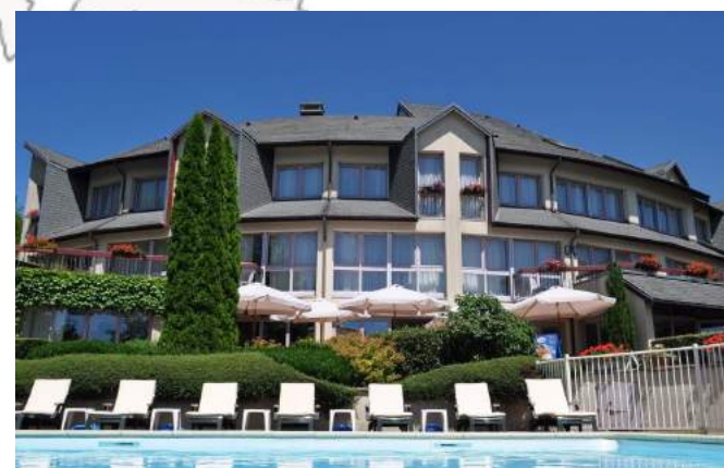
La Bastide du Cantal à Salers (15) à proximité des Golfs : 21,22,23,24 Soirée Etape à partir de 65€/p en chambre double