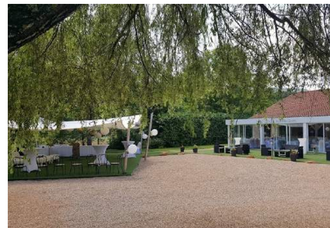
Le Domaine des Pierres Dorées à Ternand (69) à proximité des Golfs 7,8,9,10,11,12,13 Soirée Etape à partir de 70€/p en chambre double