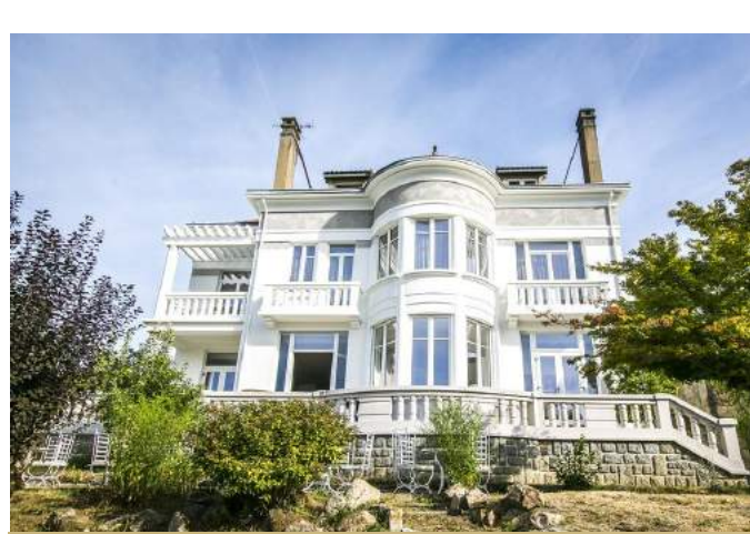
Villa Fani à Thiers (63) à Proximité du Golf 19 Soirée Etape à partir de 78€/p en chambre double