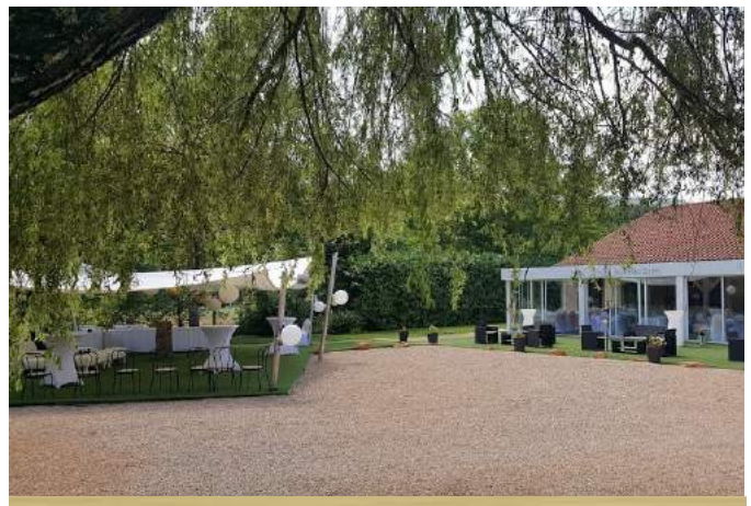
Le Domaine des Pierres Dorées à Ternand (69) à proximité du GR76 Soirée Etape à partir de 70€/p en chambre double