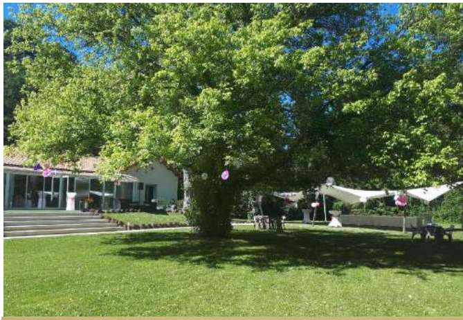
Le Domaine de la Palle à Pontgibaud (63) à proximité du GR441 Soirée étape à partir de 65€/p en chambre double