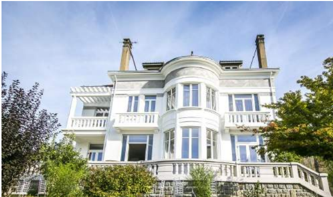
Villa Fani à Thiers (63) à Proximité du GR89 Soirée Etape à partir de 78€/p en chambre double