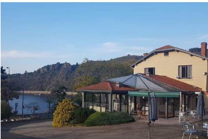
Pavillon du Lac à Saint-Etienne (42) à proximité du GR65 Soirée Etape à partir de 65€/p en chambre double