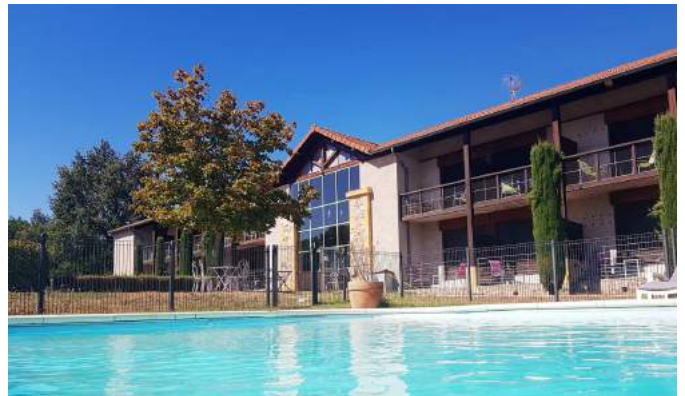
Hotel du Golf à Villerest (42) à proximité du GR7 Soirée Etape à partir de 65€/p en chambre double