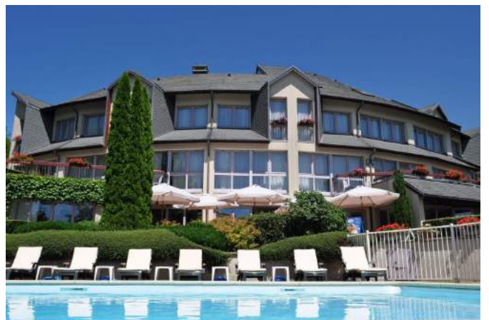
La Bastide du Cantal à Salers (15) à proximité du GR440 Soirée Etape à partir de 65€/p en chambre double